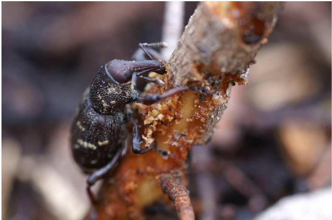
7.attēls. Lielā priežu smecernieka stipri bojāts priežu stāds: 3 pakāpe - stipri bojājumi (stāda izdzīvošana apšaubāma)