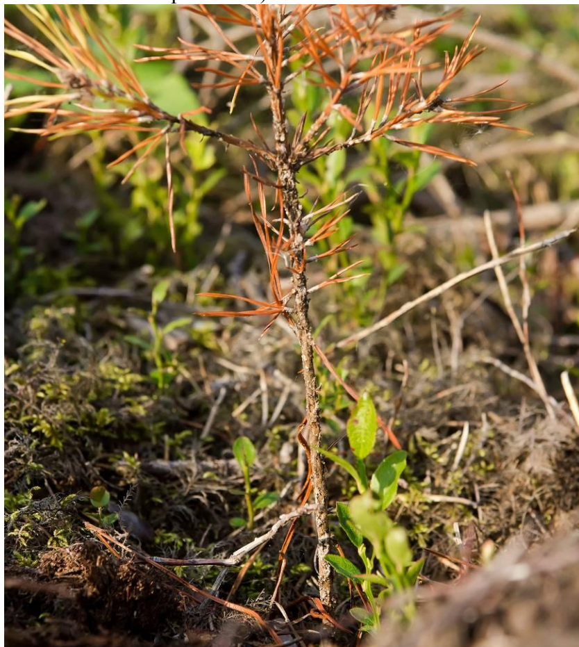
8.attēls. Lielā priežu smecernieka stipri bojāts priežu stāds: 4 pakāpe - bojājumu dēļ iznīcis