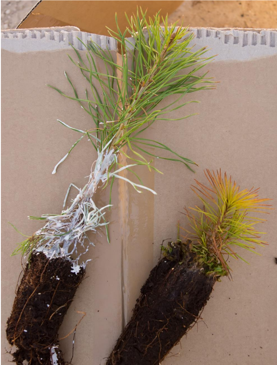
1.attēls. Ar vasku apstrādāto stādu atšķirība no pārējiem stādiem.

m, rindās – 2,5 m. Parcelā stādītas 16 kolonnas un 15 rindas (240 stādi). Parcelas platība 0,105 ha. Pirmās divas ārmalas rindas un kolonas tiek izmantotas kā bufera josla un turpmāk uzskaitēi izmantoto stādu skaits parcelā – 132 (11 rindas* 12 kolonnas), no tiem uzskaitēi izmantoti ne mazāk kā 100 stādi. Stādi stādīti ar stādāmo stobru (3.attēls).