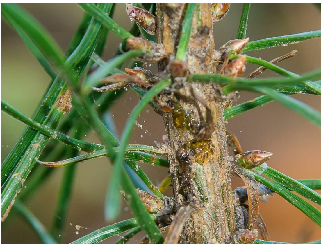
5.attēls. Lielā priežu smecernieka viegli bojāts priežu stāds: 1 pakāpe - nedaudz bojāti (atsevišķi stāda dzīvotspējai nenožīmīgi bojājumi)