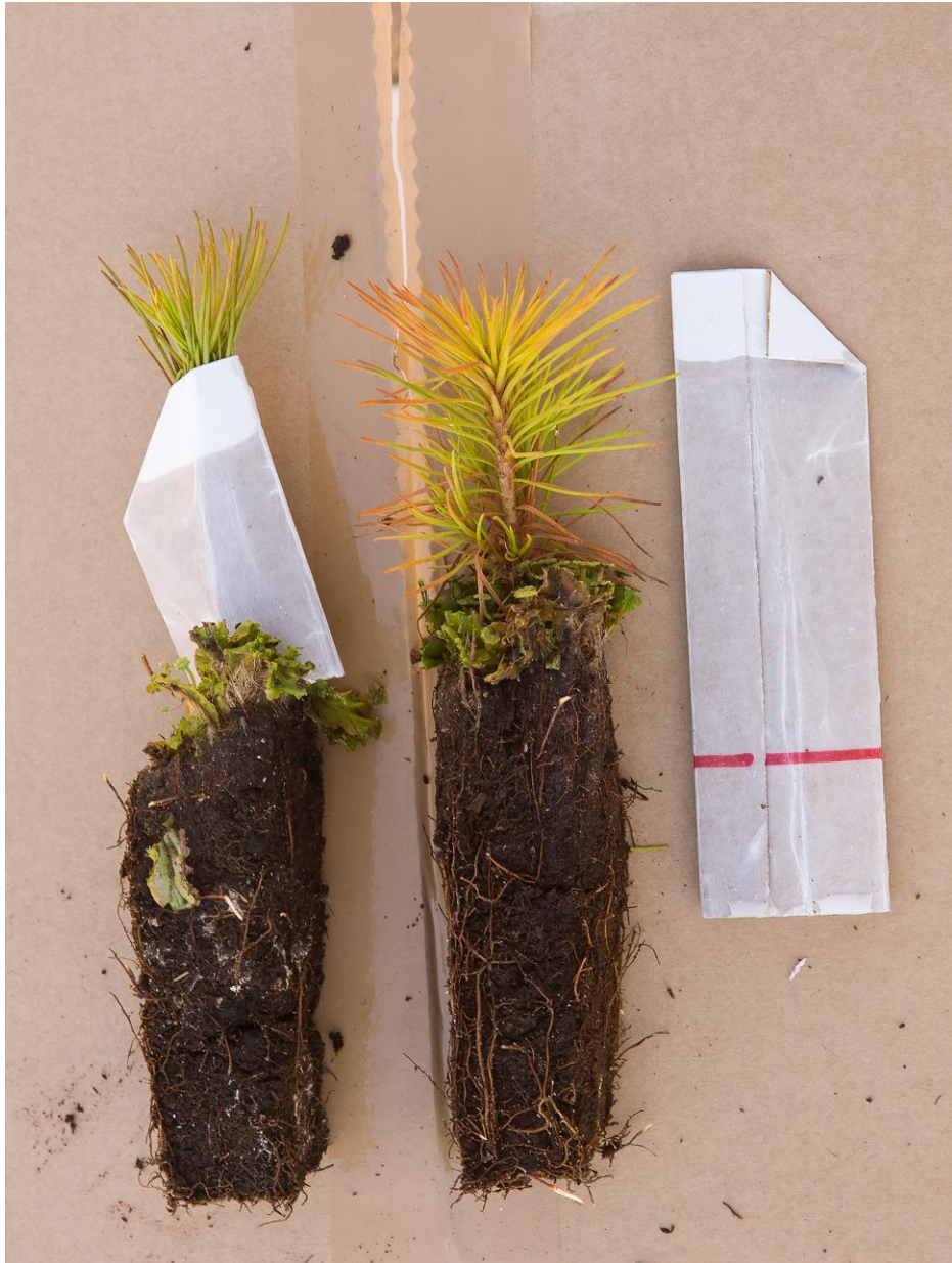
2.attēls. Viengadīgu priežu stādu izmērs nav piemērots kartona aizsargietvaru izmantošanai.