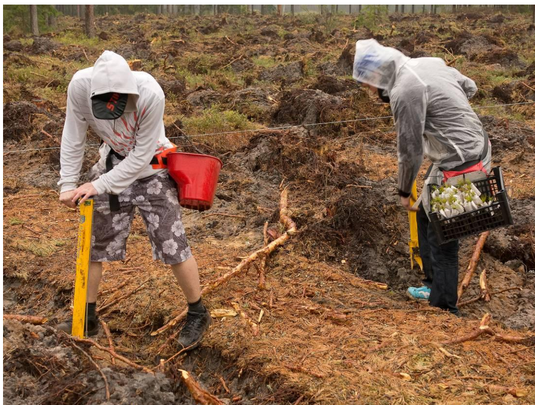
3.attēls. Stādīšana ar stādāmo stobru