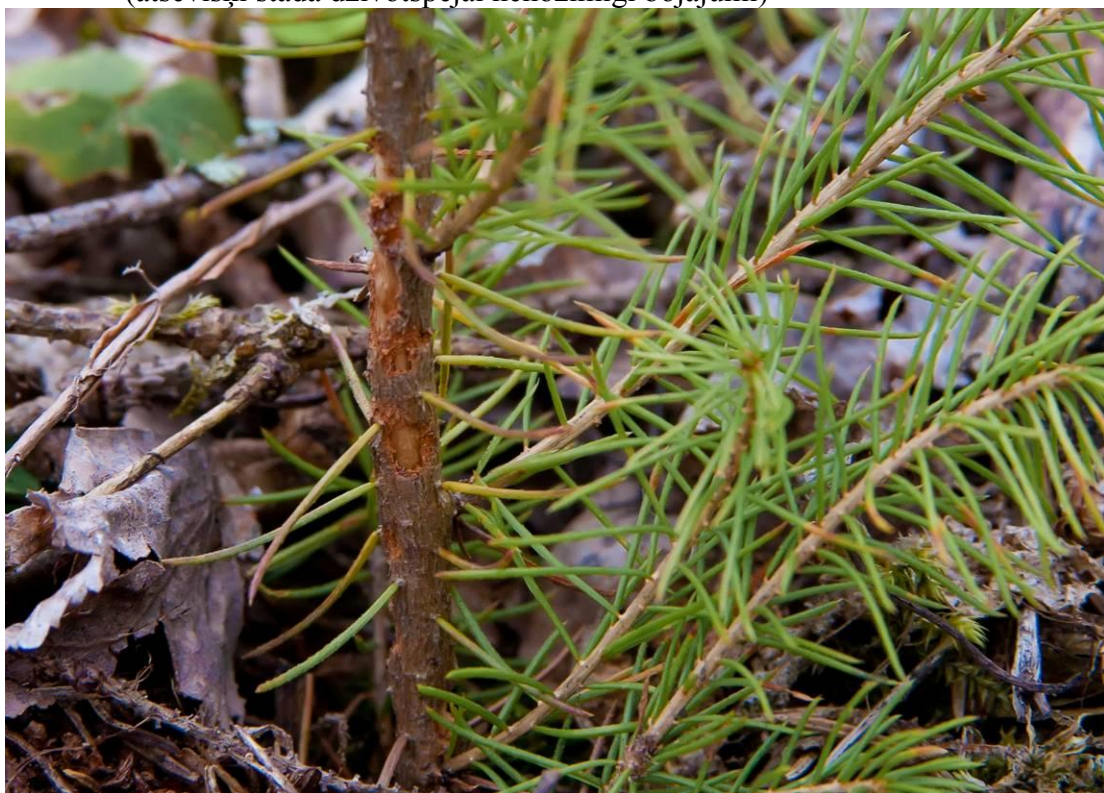
6.attēls. Lielā priežu smecernieka viegli bojāts priežu stāds: 2 pakāpe - nelieli bojājumi (bojājumi neietekmē stāda izdzīvošanu)