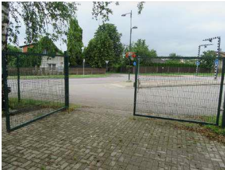
Žoga vārti (Inv. Nr. 024005)