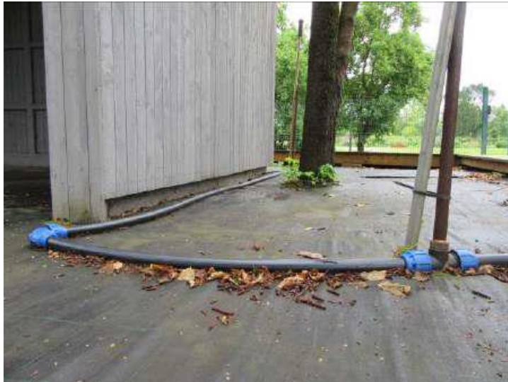
Laistīšanas sistēma (Inv. Nr. 030782) – cauruļvadu sistēma un smidzinātāji