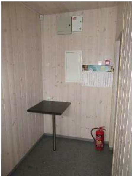
Tai skaitā – žurnāl galdiņš uz vienas kājas (ietilpst Inv. Nr. 026335)