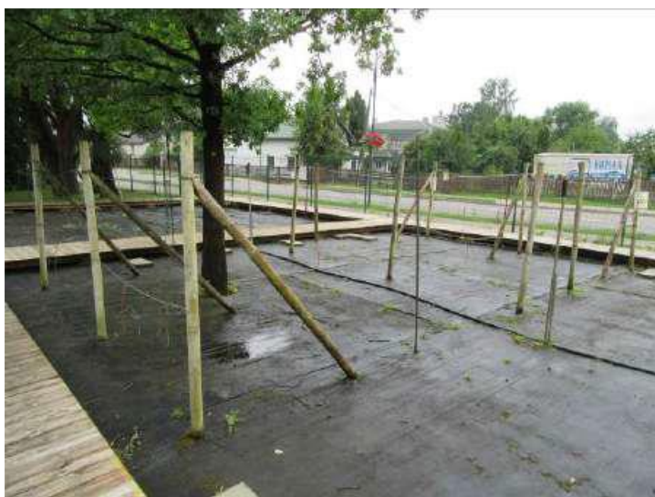
Smidzinātāji – kopskats