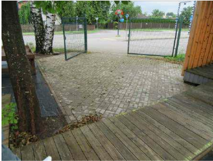
Bruġakmens laukums - 48 m 2 (Inv. Nr. 024001)