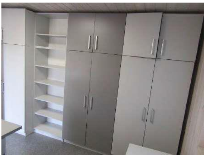
Trīs aizvērtā un viens atvērta tipa skapis