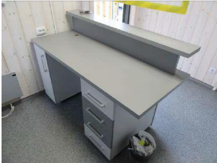
Mēbeļu komplekts (Inv. Nr. 026335) – Lete/galds