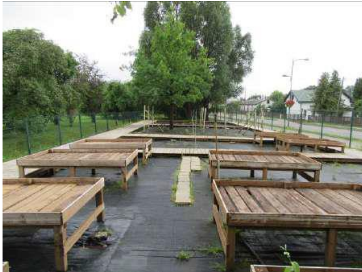
Smidzinātāji – kopskats