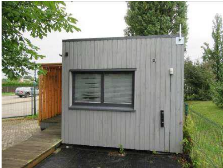
Tirdzniecības kiosks/ pārvietojamā ēka (Inv. Nr.026304)