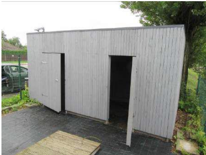
Pārvietojamā saimniecības palīgēka 5.4x2.5x2.7m (Inv. Nr. 026337)