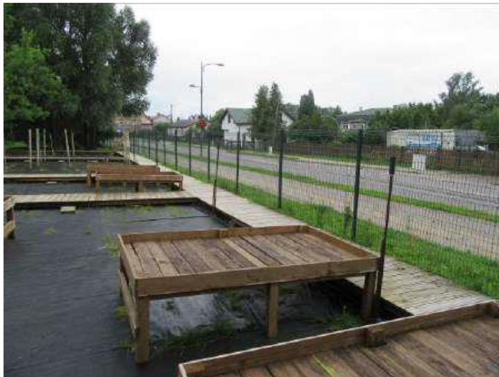
Smidzinātāji – kopskats