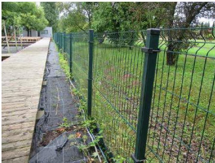
3D Žogs (Inv. Nr. 024169)