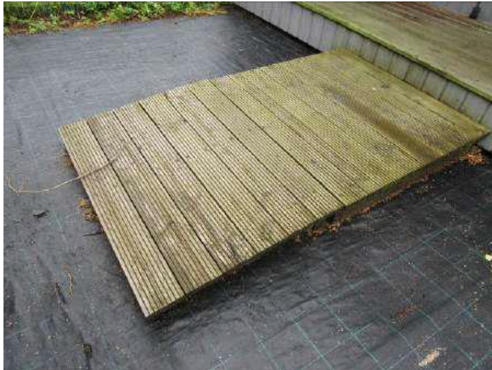
Koka laipas gājējiem - 288 m 2 , tai skaitā tirdzniecības galdi (Inv. Nr. 031851)