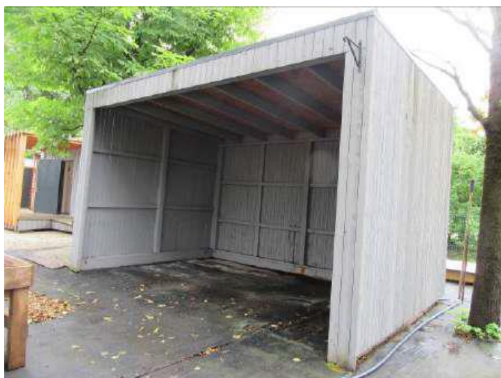
Pārvietojama nojume 4.5x3.0x2.8m ar trim sienām (Inv. Nr. 026336)