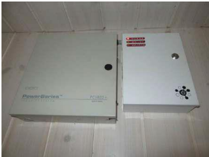
Signalizācijas apsardzes sistēma (Inv. Nr.019286)