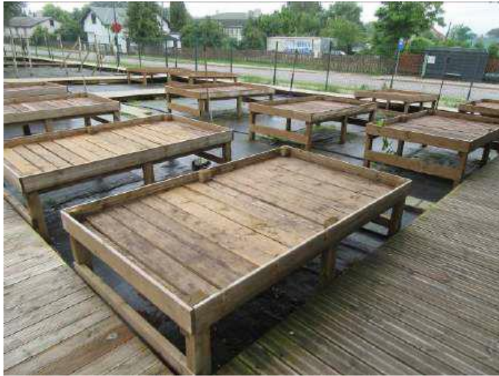
Tirdzniecības galdi - kopskats