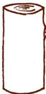
Pareizi veikta atzarošana